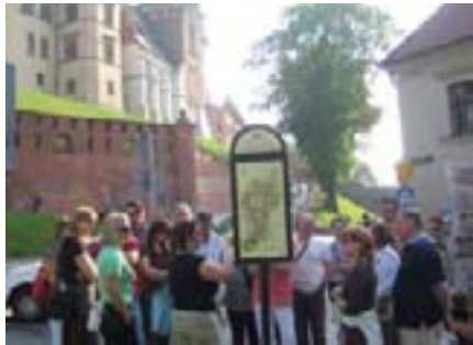
A naša 'vodičica', gđica Katarina Brusić je davala sve od sebe