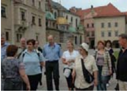
Željani informacija o ovom predivnom gradu, upijali smo svaku riječ