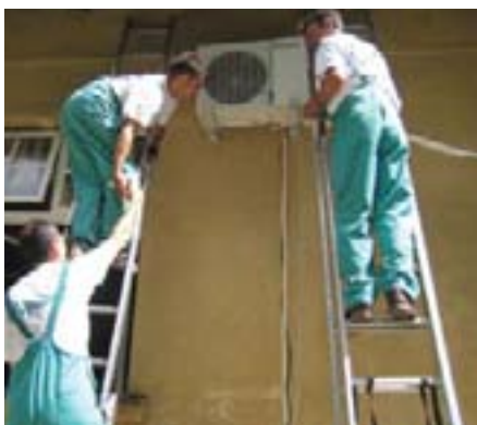
KIV-ovci su zaista pokazali da zajedničkim snagama možemo bolje i više

Osim na realizaciju cjelokupne akcije, ponosni smo i na činjenicu da su se članovi Kluba Instalatera Vaillant složili da ovo postane tradicija te da se svake godine na zajedničkom druženju osmisli slična donacija humanitarnog karaktera.