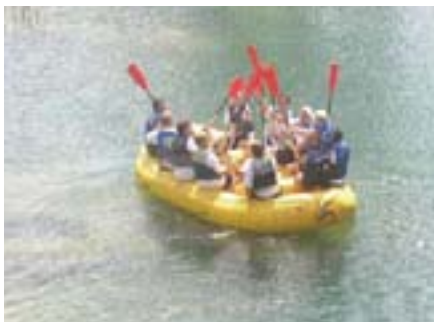
Rafting na predivnoj Mrežnici zaista je jedinstveno iskustvo

Ploveći rijekom vratili smo se do restorana gdje nas je čekao topli grah s kobasicama te fiš paprikaš. Nakon još jednog ukusnog obroka, uz glazbeni sastav Strings svi smo zajedno zapjevali i zaplesali. Takva usijana atmosfera potrajala je sve do povratka u Zagreb u večernjim satima.