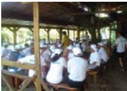
Doručak na obali Tare je bio prava poslastica

Podjela ekipa u čamce označila je početak utrke za najuspješnije veslače kroz bukove ćelije, Borovi i Vjernovići koji su označeni kategorijom 4 radi opasne dubine i oštarih stijena. No ni manji bukovi nisu bili za zanemariti budući da su serviseri morali veslati punom snagom. Na svakoj mirnijoj dionici puta borba za bolju poziciju bila je žestoka pa su serviseri