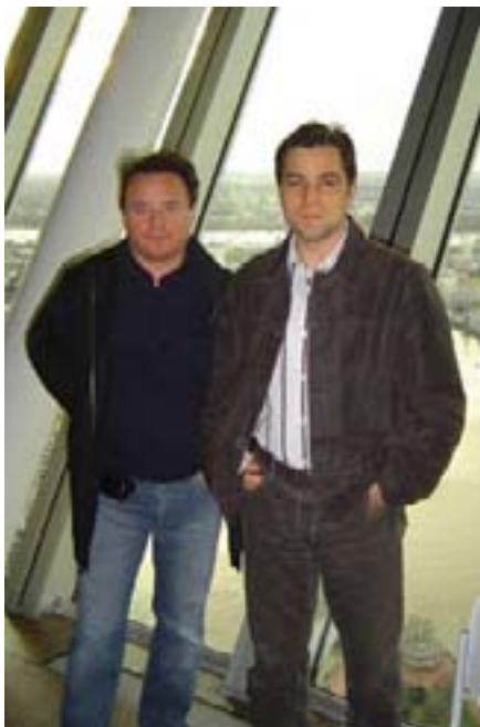
Na televizijskom tornju u Düsseldorfu

Ovom prilikom zahvaljujemo svim zaposlenima u tvrtki Termo Trade d.o.o. te im u budućnosti želimo još uspješnije poslovanje!