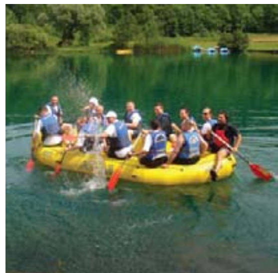
...dok je na ovogodišnjoj više sudjelovao u timskim sportovima