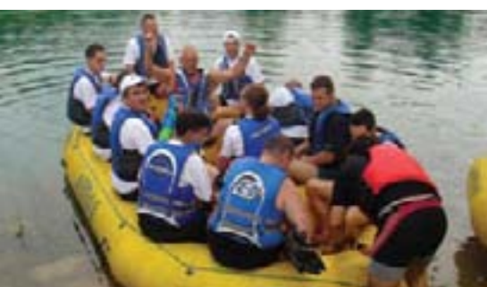
Timski duh se osjećao u svakom čamcu