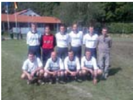
Ekipa na okupu

Obzirom da su iz godine u godinu naši igrači sve bolji, a navijači sve žešći, vjerujemo da ćemo sljedeći puta postići još bolji rezultat. Čestitamo našoj momčadi na postignutom plasmanu!