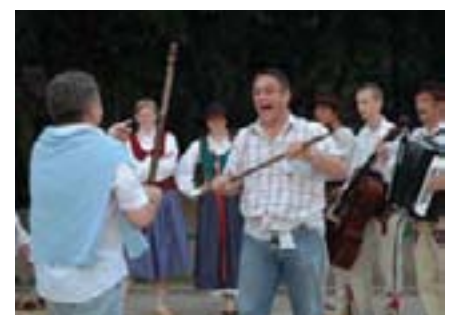
...u nekim vještinama smo se i sami iskazali