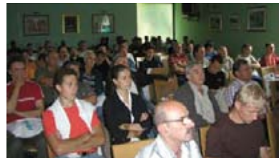
U službenom dijelu mogle su se saznati mnoge zanimljive informacije