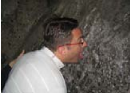
Neki su se i sami uvjerali da se zaista nalazimo u rudniku od soli