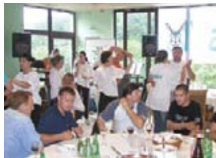
...no, to nije nimalo utjecalo na dobru atmosferu!

Na kraju bismo još samo željeli napomenuti kako smo izuzetno zadovoljni zajedničkim druženjem koje smo ostvarili u ova dva dana. Još jednom zahvaljujemo svima koji su se odazvali pozivu na skupštinu, kao i spomenutoj humanitarnoj akciji! Vidimo se ponovno na zimu!