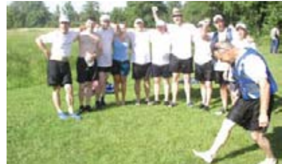
Svi timovi su bili pobjednici