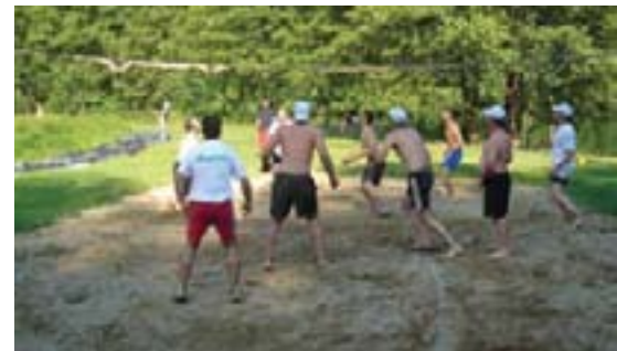
Dok su čamci plovili rijekom, sportaši su igrali odbojku na pijesku