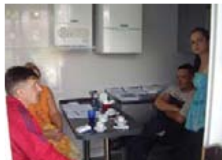
Ljubazni djelatnici Vaillanta spremno su odgovarali na sva postavljena pitanja

Što reći na kraju osim da ćemo se potruditi da i iduće godine naš Infomobil bude uspješan u promoviranju uređaja za koje smo dobili visoke ocjene kako krajnjih korisnika tako i uvaženih partnera iz struke.