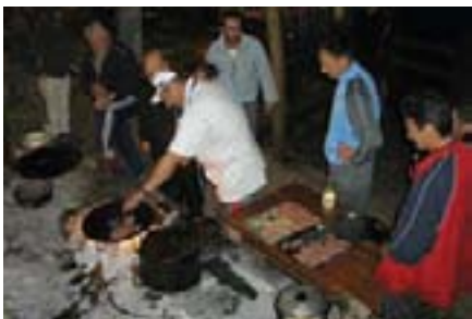
Vode timova su za svoje ekipe pripremali jela sa roštilja

Vaillant d.o.o. Sarajevo ovim putem želi zahvaliti svim svojim serviserima koji su pokazali veliku hrabrost i vještinu te im obećavamo podjednako dobar provod i na sljedećem druženju!