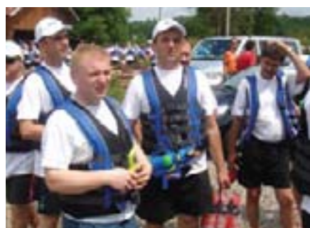
Neki su ponijeli i potrebno 'naoružanje'

U utorak ujutro kiša je pljuštala doista „kao iz kabla“. No to nije nimalo pokvarilo raspoloženje KIV-ovaca s područja grada Zagreba i okolice. Po završetku prethodno spomenutog službenog dijela slijedio je ukusan i obilan ručak kako bismo prikupili