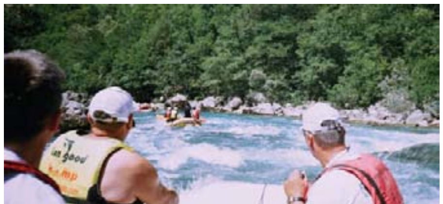
Serviseri su se provodili u ljepotama najdubljeg kanjona u Europi...