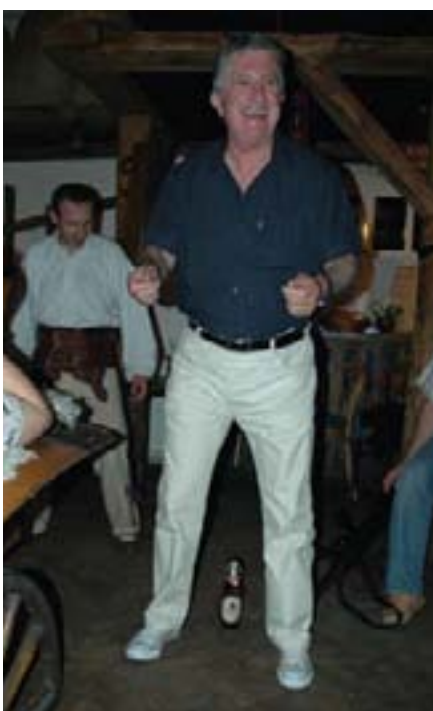
Svojestvene igrice bile su pripremljene kako za muški...