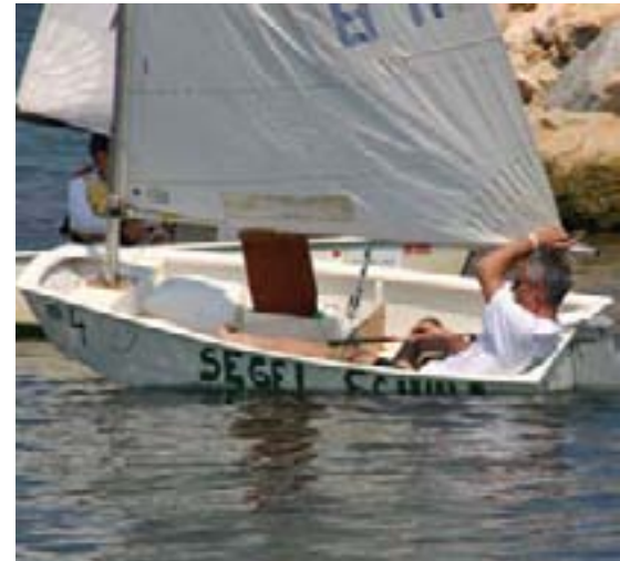
Neki su imali problema s ravnotežom...

Nakon regate na red je došla i utakmica u vožnji s buggy automobilima koju smo svi očekivali s nestrpljenjem. Tu se mogao vidjeti natjecateljski duh baš svih sudionika jer su se u teškim uvjetima - vodi i blatu - borili do zadnjeg daha.