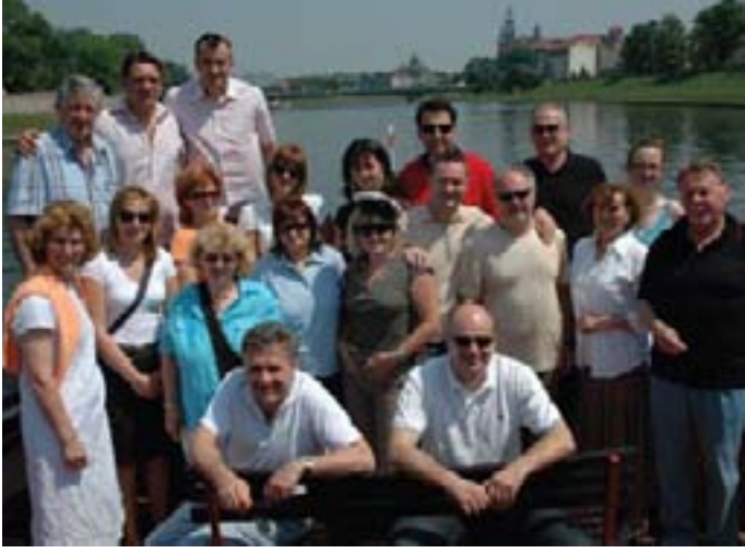
Fotografija s rijeke Visla za dugo sjećanje