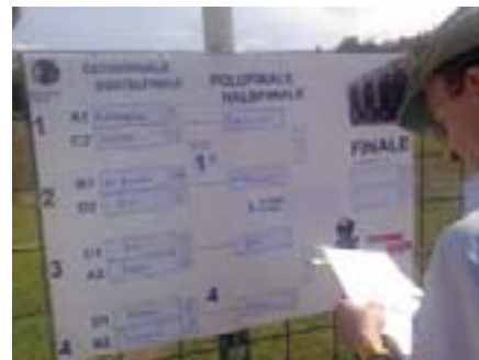
Vaillantova ekipa je završila turnir u četvrtfinalu