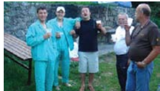
Dobroj atmosferi u četvrtak su doprinijeli veseli Vinkovčani