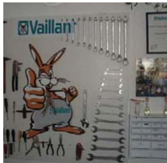
Vaillantov zeko zadužen je za 'čuvanje' alata u radionici