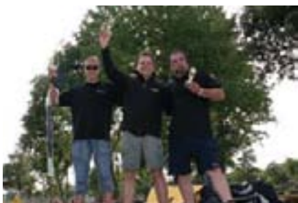
No, i "blatnjava" utrka je imala svoje pobjednike