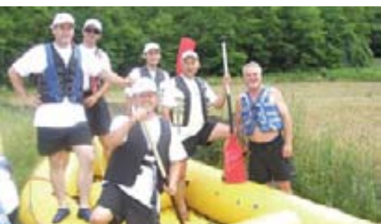
Vesla u ruke...