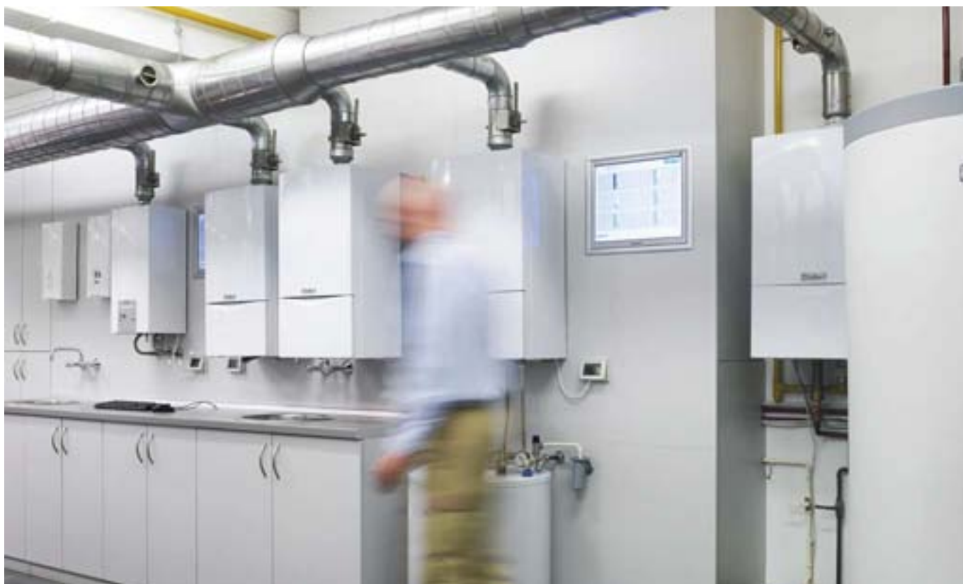
Suvremeno uređeni praktikum sastavni je dio VEC-a

Na kraju želimo zahvaliti svim našim partnerima na doprinosu što smo vodeći brend u našem području. Djelatnici Vaillanta stoje Vam na raspolaganju kako bi Vam pomogli u poslovanju da zajedno budemo još uspješniji.