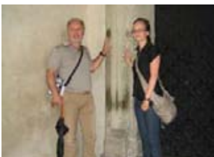
Navodno ljekovito energetsko zračenje isijava upravo iz ovog stupa

u noć i time okončali još jedan ispunjen i lijep dan.