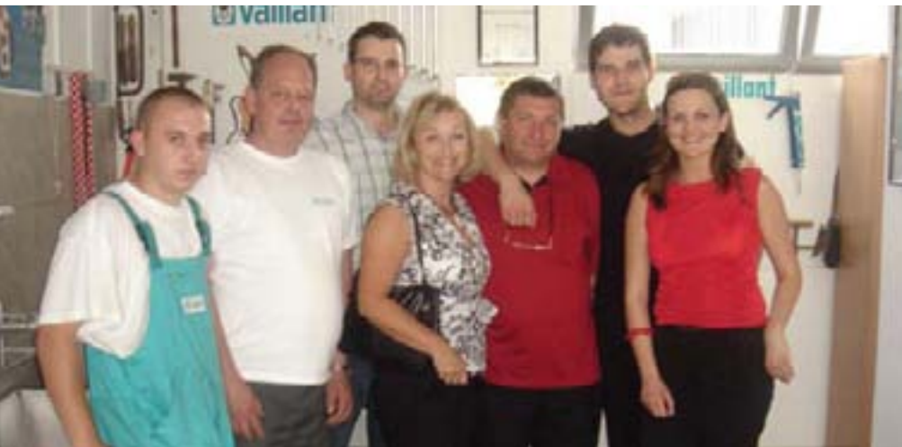
Na otvorenju radionice u svibnju ove godine sa svojom radnom ekipom i djelatnicima Vaillant