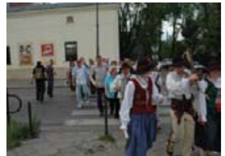
Na putu do našeg restorana pratila nas je skupina nacionalnih glazbenika i animatora

Ispunjeni različitim dojmovima, prijateljskim druženjem i zabavom svi smo tog četvrtoga dana prije samoga povratka poželjeli da vrijeme do sljedećeg ovakvog putovanja što brže prode.