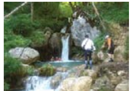
Najhrabriji su odmjerili snage u ledenom vodopadu