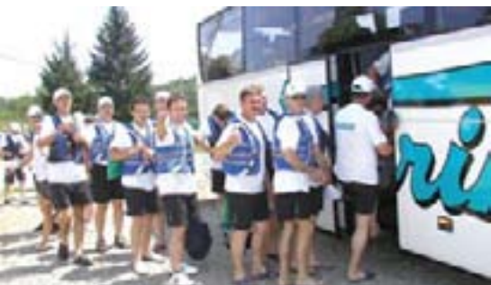
Za rafting spremni!