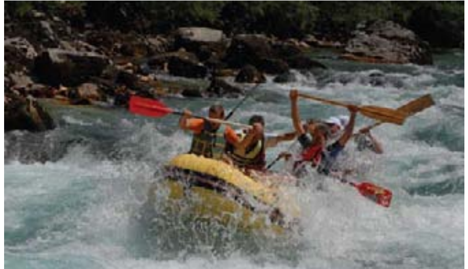
Divlja Tara je bila pravi izazov

iskoristili vesla za bitku na vodi gdje su i skiperi dali svoj doprinos nastojeći usporiti suparničke čamce prskajući ih vodom. Potrebno je naglasiti da pri ovim akcijama nitko nije bio ozlijeđen, jedina šteta bilo je kupanje u vodi koja je bila izuzetno hladna.