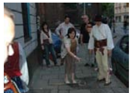
A kako bi ušli u restoran, bacali smo potkove za sreću