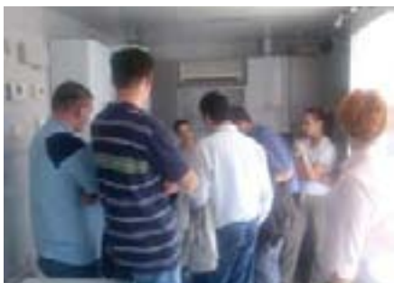
Gužva u Vaillantovom Infomobilu je bila neizbježna

Ove je godine Vaillant d.o.o. Sarajevo pažljivo osmislio prezentacije Infomobilmom u svim značajnijim gradovima u BiH. Krajnji korisnici izrazili su svoje zadovoljstvo već kupljenim uređajima, a ljubaznost i izlaganje djelatnika o kvaliteti naših proizvoda pomogli su da se čak i slučajni prolaznici zainteresiraju za kupnju. Bila je to izuzetna prilika da se iz prve ruke čuje mišljenje o izgledu i karakteristikama koje nudi nova generacija plinskih uređaja, a iznenadila nas je i činjenica koliko se stanovništvo bavi razmišljanjem o obnovljivim izvorima energije za grijanje i pripremu potrošne tople vode. Tako smo odgovorili na nekoliko upita vezanih za solarne sustave i toplinske crpke za koje očekujemo da će u sljedećem periodu postati vrlo popularni u dijelovima BiH koji nisu u mogućnosti upotrebljavati zemni plin.