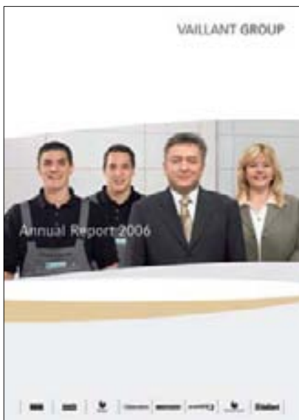
Naslovnica Poslovnog izvješća Vaillant Group za 2006.g.

Osim navedenog, ističe se i izjava koja vjerno ocrtava današnje Vaillantovo poslovanje: „Biti uvijek na vrhu, naša je stalna težnja. Kao vodeći svjetski proizvođač opreme za grijanje i klimatizaciju postavili smo zahtjev stalnog rasta. Poslujemo globalno, učinkovito i usmjereni smo prema korisnicima. Naš je zajednički cilj biti najbolji u svemu što radimo.“