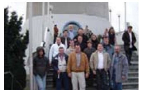
Uspomena na posjet Düsseldorfu