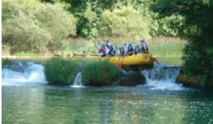
I 'najteži' zadaci bili su nam lagani