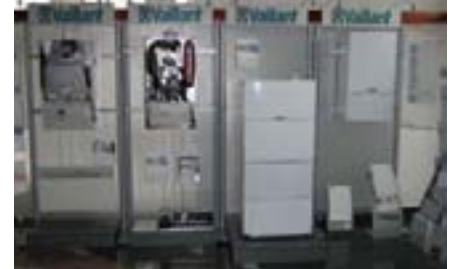
Lijepo uređeni izložbeni salon sastavni je dio tvrtke