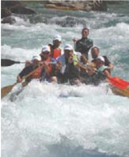
Mnogi su uživali u brzacima rijeke