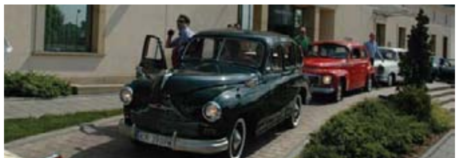
...no najnezaboravnija je ipak bila vožnja oldtimerima!