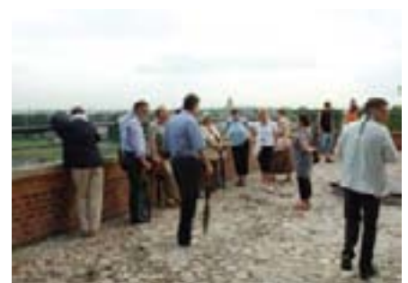
Krakov je zaista je jedan od zadnjih neotkrivenih gradova dragulja u Europi