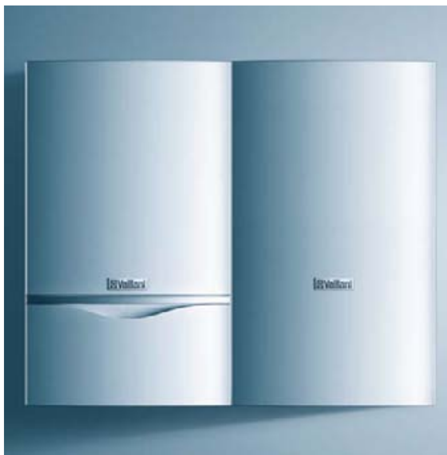
ecoTEC pro u kombinaciji sa spremnikom VIH CB 75

Velika je novost što je od ove godine dostupan zrako/dimovodni sustav Ø60/100 te sa postojećim sustavima Ø80/125, Ø80/80, Ø80 čini cjelokupnu ponudu pribora za dovod zraka i odvod dimnih plinova. U slučaju kada je potrebno povezati više uređaja u kaskadu moguće je također upotrebljavati originalni sustav DN 130 PP.