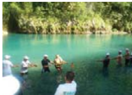
Povlačenje konopca se odigralo u rijeci