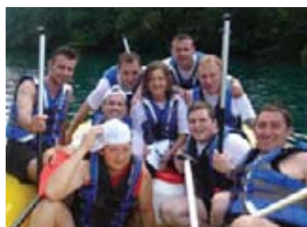
U dobrom društvu...