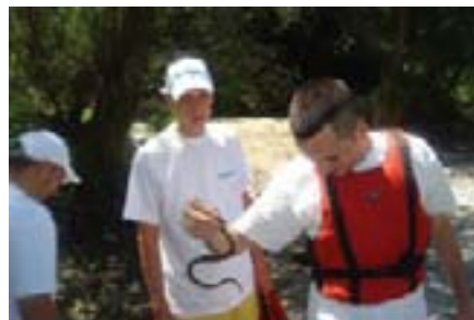
Kolega iz tvrtke Ergas pozirao je sa zmijom za Vaillant plus