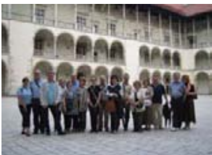
...koji nas je očarao svojom arhitekturom i povjesnim pričicama