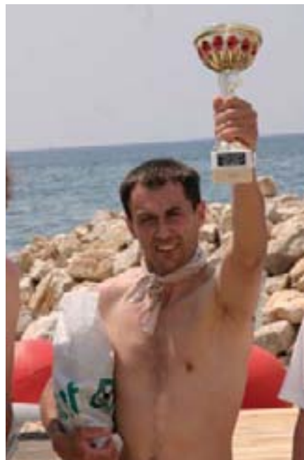
Neizbježan osmjech na licu prilikom zaslužene pobjede