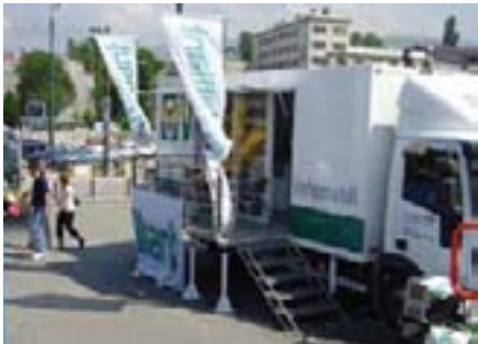
Ove su godine osmišljene prezentacije Infomobilmom u svim značajnijim gradovima u BiH