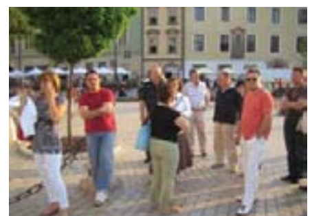
Srećom, na gradskim trgovima nas je pratilo lijepo vrijeme