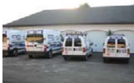
Sva servisna vozila su kvalitetno opremljena