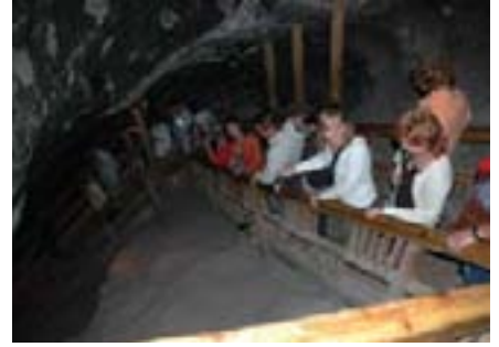
Spuštanje u rudnik soli Wieliczka nije bilo baš ugodno

Počeci rudnika sežu u daleku drugu polovinu 13. st. Od tada se rudnik sve više prokopavao te je samom gradu ali naravno i pokrajini bio unosan i siguran izvor blagostanja. Wieliczka se spušta 327 m u dubinu preko pet razina. Ukupna dužina rudničkih staza iznosi 250 km. Iskopano je više od 2040 komora koje su s vremenom između ostalog preinačene u kapele i