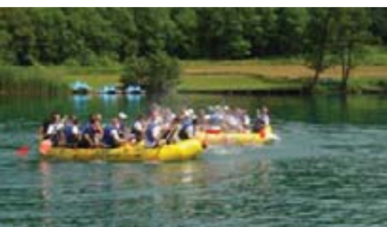
Špricanje je bilo sastavni dio svih aktivnosti

I ovoga smo se lipnja ugodno družili s članovima KIV-a na još jednoj ljetnoj skupštini kluba. Tako smo ove godine za naše KIV-ovce organizirali cjelodnevno druženje na obali rijeke Mrežnice u restoranu Zeleni kut Puškarić, a najbolje smo se zabavili na raftingu.