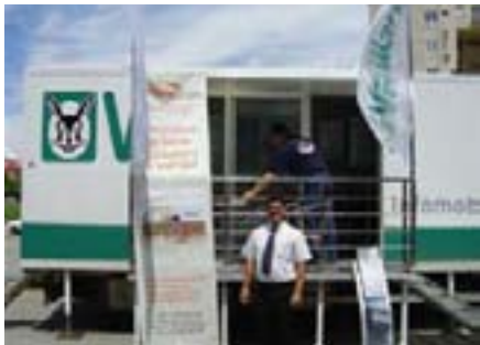
Vaillantovi dugogodišnji partneri također su sudjelovali u prezentaciji proizvoda