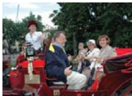
Vožnja gradskim kočijama ima svog šarma...