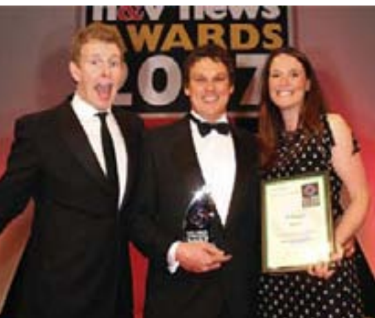
Vaillant Ltd. iz Velike Britanije je dobitnik prestižne H&V News Award

Vaillant Ltd., britanska podružnica tvrtke Vaillant GmbH, vodećeg europskog proizvođača opreme za grijanje i klimatizaciju dobila je na uglednom natječaju H&V News Awards za 2007. godinu nagradu za „Proizvod godine koji se koristi obnovljivim izvorima energije“ (Renewable Product of the Year). Ovogodišnje su nagrade dodijeljene na prigodnoj svečanosti koja je održana 3. svibnja. Vaillant je tom prilikom nagrađen za svoje 'rješenje cjelokupnog solarnog sustava' (Total Solar System Solution).