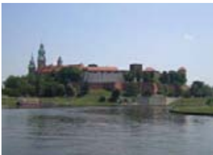
Slijedeća stanica bilo je razgledavanje dvorca Wawel...