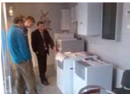
Mnogi krajnji korisnici su izrazili svoje zadovoljstvo već kupljenim uređajima