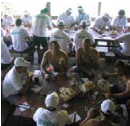
Ukusna hrana pomogla je svima da se pripreme za rafting