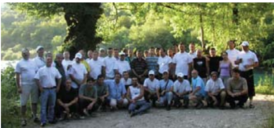
Ugodno druženje zabilježili smo zajedničkom fotografijom