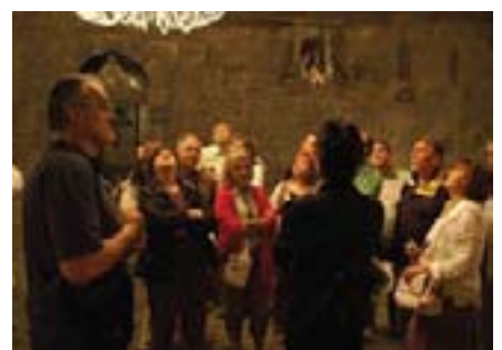
Komore u kojima smo boravili bile su fascinantne