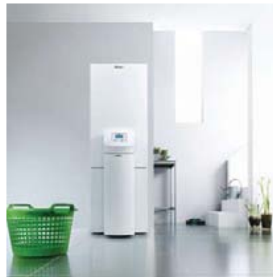
Pobjednica Stiftung Warentest - toplinska crpka geoTHERM

Pri tome je nagrađena dizalica topline geoTHERM plus VWS 102/2 koja je dobila najvišu ukupnu ocjenu 2,1 ('dobar'). Pri ispitivanju su razmatrani uređaji još sedam uglednih proizvođača (Alpha-Innotec, Stiebel Eltron, Dimplex, Junkers, Waterkotte, Viessmann i Nibe). Promatralo se pet različitih kategorija: energetska učinkovitost, udobnost i energetska učinkovitost pri pripremi potrošne tople vode, rukovanje, završna obrada te druga ekološka svojstva. Vaillantova toplinska crpka dobila je najvišu ocjenu 'vrlo dobar' u dvije od pet navedenih kategorija.