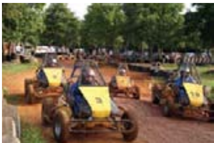
Nestrpljenje na startnim pozicijama je bilo očito

Tako se naše druženje polako približavalo kraju. Vrijeme koje smo proveli zajedno u opuštenoj atmosferi proteklo je prilično brzo. Pred kraj su neki još iskoristili svoje vrijeme na plaži i osvježili se u moru, dok su ostali polako krenuli prema svojim kućama. A bez sumnje stoji ono što smo se dogovorili na kraju - vidimo se opet i dogodine!