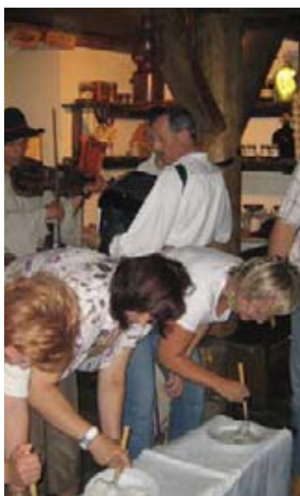
...tako i za ženski dio publike