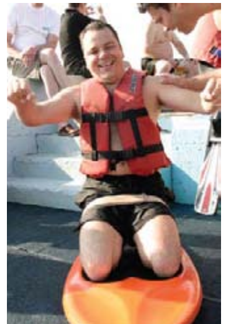
Mnogima je bila potrebna koncentracija prije vožnje kneeboardom