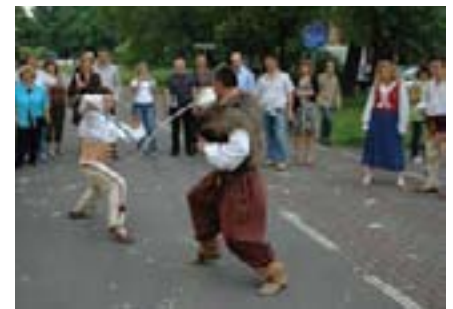
Iako su animatori bili izuzetno spretni...