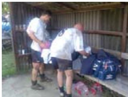
Ujutro je blato bilo zaista do koljena...