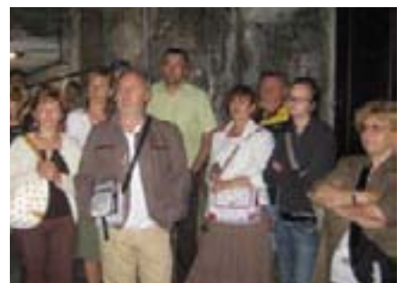
A povijest samog rudnika vrlo zanimljiva