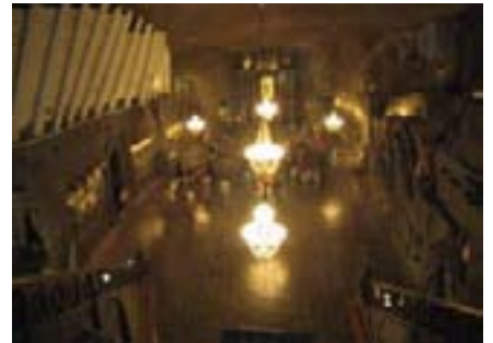
Ali ono što nas je dočekalo je zaista oduzimalo dah