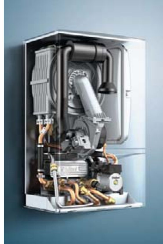
Kondenzacijski uređaji postaju nezaobilazni standard suvremenog doma

Danas se više nego ikada prije govori o energetske učinkovitosti i ekologiji. Vremena kada krajnji korisnik nije znao ništa o uređajima za grijanje i pripremu potrošne tople vode polako ali sigurno prolaze. Sve se više postavljaju pitanja o iskoristivosti uređaja, potrošnji, energetskim bilancama i cijelom nizu drugih pitanja na koje se želi dobiti odgovor. Iako 'konvencionalni' uređaji u Hrvatskoj još uvijek imaju najveći udio u prodaji, sa zadovoljstvom možemo ustvrditi da se posljednjih godina situacija mijenja i postotak kondenzacijskih uređaja raste.