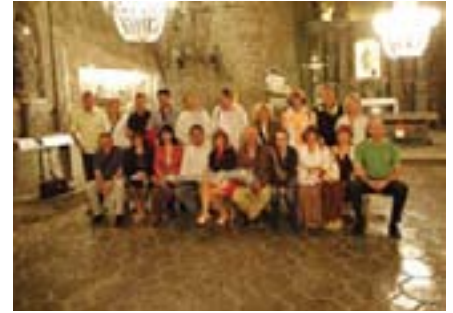
Zajednička uspomena na rudnik Wieliczka

umjetničke dvorane sa skulpturama od soli te se upotrebljavaju kao lječilište za osobe s dišnim teškoćama, dok se neke komore koriste za velike zabave. O kojim je dimenzijama riječ, vidi se iz podatka da se turistička ruta proteže na samo 3% ukupnih prostorija. Prirodne špilje, jezera i nevideno veliki solni kristali nadopunjuju ovo zadivljujuće mjesto. Uostalom svatko od nas kušao je zidove rudnika kako bi se uvjerio da su zaista od soli. Od 1978. ovaj je rudnik na popisu UNESCO-a, a time i zaštićen objekt svjetske kulturne baštine. Scene rudarskog života, koje su inscenirane putem turističke rute, zorno su nam dočarale mukotrpan rad žena, muškaraca ali i djece i životinja. Svakom čitatelju toplo preporučamo posjet nezaboravnom rudniku Wieliczka.