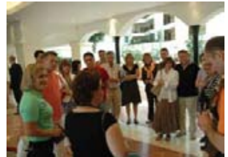
Prvo zajedničko okupljanje bilo je u hotelu Sheraton

Uživali smo u tipičnim židovskim specijalitetima i košer vinu dok su nas zabavljali glazbenici svojim tradicionalnim glazbenim repertoarom. Zabavljali smo se do kasno