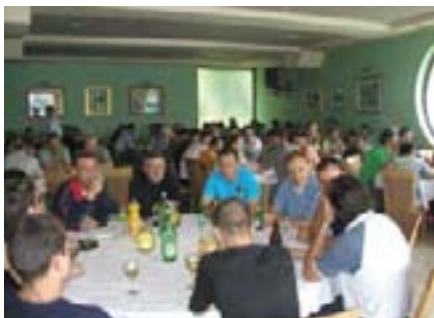
U utorak nas je vrijeme natjeralo da budemo više u zatvorenom prostoru...