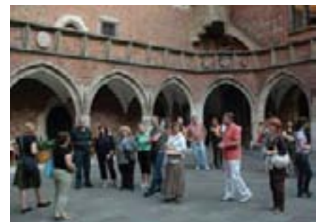
Naše prvo popodne u Krakovu smo proveli u razgledavanju grada