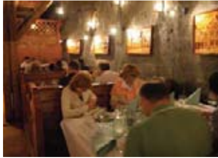
U jednoj od komora nas je dočekao i ukusan ručak