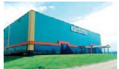
Proizvodni pogon Demir Döküma

U prošlosti je Vaillant Group uspješno preuzela i unaprijedila nekoliko tvrtki.